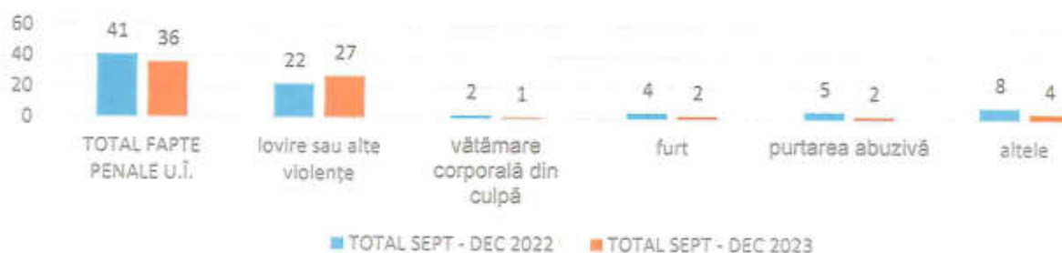
Infracționalitatea sesizată în unitățile de învățământ în perioadaseptembrie - decembrie 2023, comparativ cu anul 2022

Pe tipuri de unități de învățământ, situația infracțională în perioada septembrie – decembrie 2023, comparativ cu perioada similară din anul 2022, se prezintă astfel: